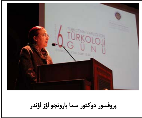
پروفیسور دوکتور سما باروتجو اؤز اؤندر

داها اؤنجه کی «تورکولوژی گونو» توپلانتیلاریندا آغیرلیقلى اولراق تورکجه نین حیاتی، دیل سیاستی و دیل پلانلارلی و ایفبا مسئله سی اله آلینمیشدی.